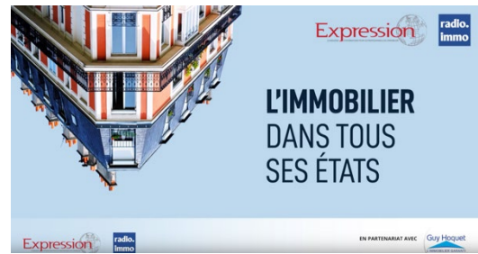
Plateau de l'émission L'immobilier dans tous ses états – 23 mars 2021

Disponibles sur le site radio-immo.fr , les podcasts des émissions sont à retrouver sur le blog et le site du groupe Acheter-louer.fr ainsi que sur acheterlouerpro.fr , les newsletters de MaLettreImmo et de MaLettreHabitat. Par ailleurs, ils peuvent être téléchargés sur tous les sites et les applications mobiles de podcasts, YouTube, Dailymotion, réseaux sociaux et en référencement sur les moteurs de recherche Google, Bing, Qwant.